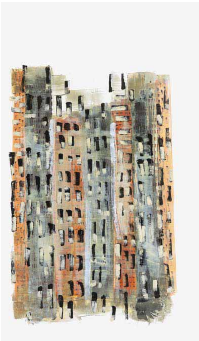
Totems City - toile - technique mixte - 135x220