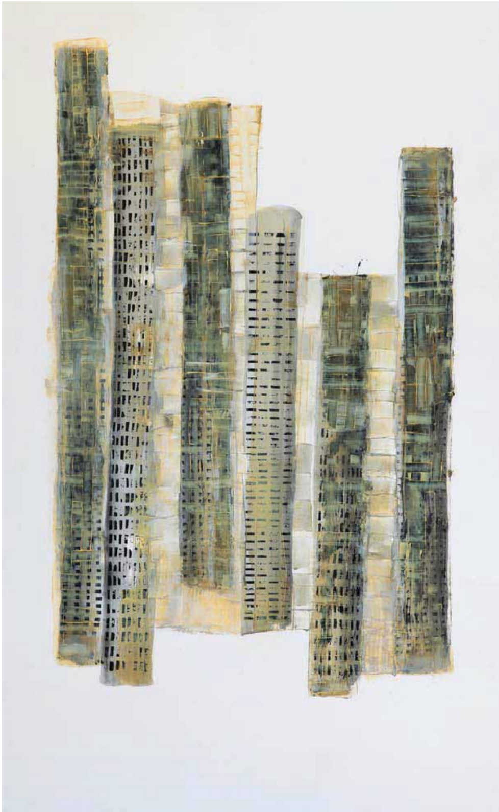
Totems City - toile - technique mixte -135x220