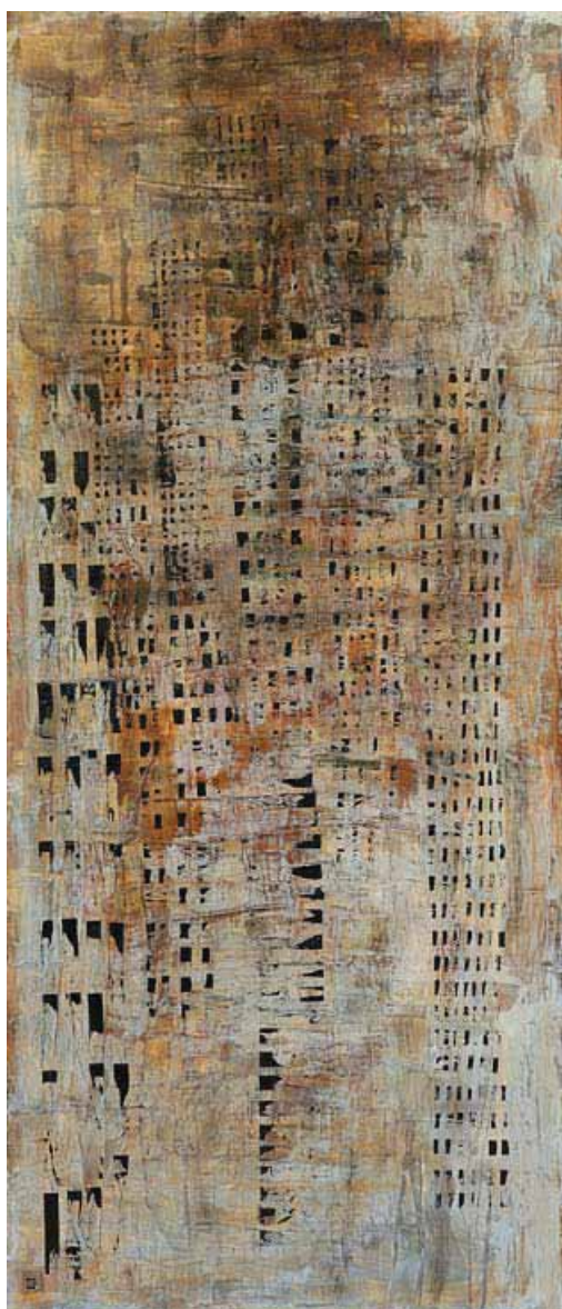
Totems City - toile - technique mixte - 216x96