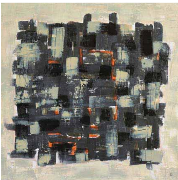
Villes labyrinthe - toile - technique mixte -150 x150

Puis, renversement de la vision. Sur la toile ou le papier posés au sol, la densité urbaine d'abord affrontée comme champ de totems se projette vue d'en haut en compositions labyrinthiques. Fils serrés des rues entrelacées, tissu dense des circulations urbaines, réseaux inextricables, étroitement mêlés, tissent l'étoffe d'une œuvre qui prend à la fois chair et distance. Ce sera « Villes labyrinthe », la deuxième collection, renouant avec le toucher de l'œil et son plaisir, avec la patience, avec la sagesse. « Se perdre pour se trouver ». C'est tout le cheminement de l'artiste, en même temps que celui de l'œil sur la toile. Jusqu'à la chambre secrète, celle, dit-elle, « de la paix en soi ».