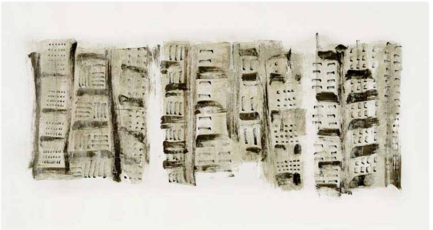
Totems City - papier chinois - technique mixte - 68x135

Elle s'installe en Avignon en avril 2009 et investit le Grenier à sel en avril 2010 pour présenter Totems City et Villes Labyrinthe .