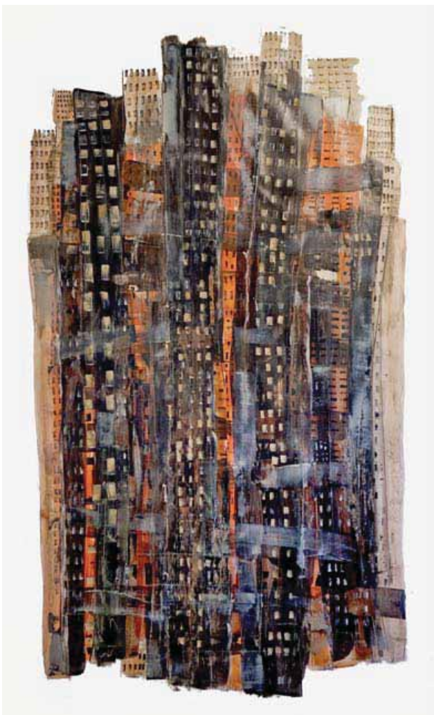
Totems City - papier - technique mixte - 150x240

Ce faisant, il ramènera en ce lieu l'art contemporain. Une vocation qui sommeillait depuis la dernière grande exposition Gaston Chaissac en 2003.