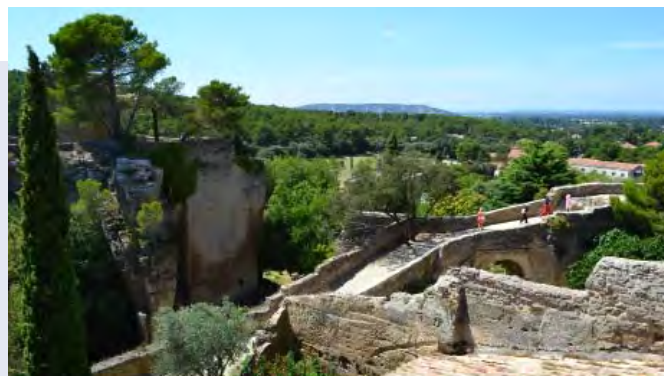
Sur les hauteurs des Taillades, un village de carriers taillé dans la pierre.

Route de Saint-Pantaléon - 84220 Gordes - Tél. 04 90 72 22 11.