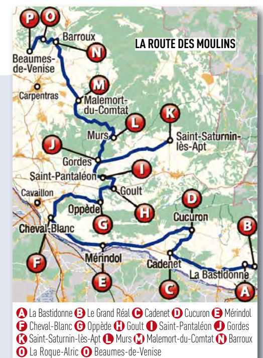
A La Bastidonne B Le Grand Réal C Cadenet D Cucuron E Mérindol F Cheval-Blanc G Oppède H Goult I Saint-Pantaléon J Gordes K Saint-Saturnin-les-Apt L Murs M Malemort-du-Comtat N Barroux O La Roque-Alric P Beaumes-de-Venise