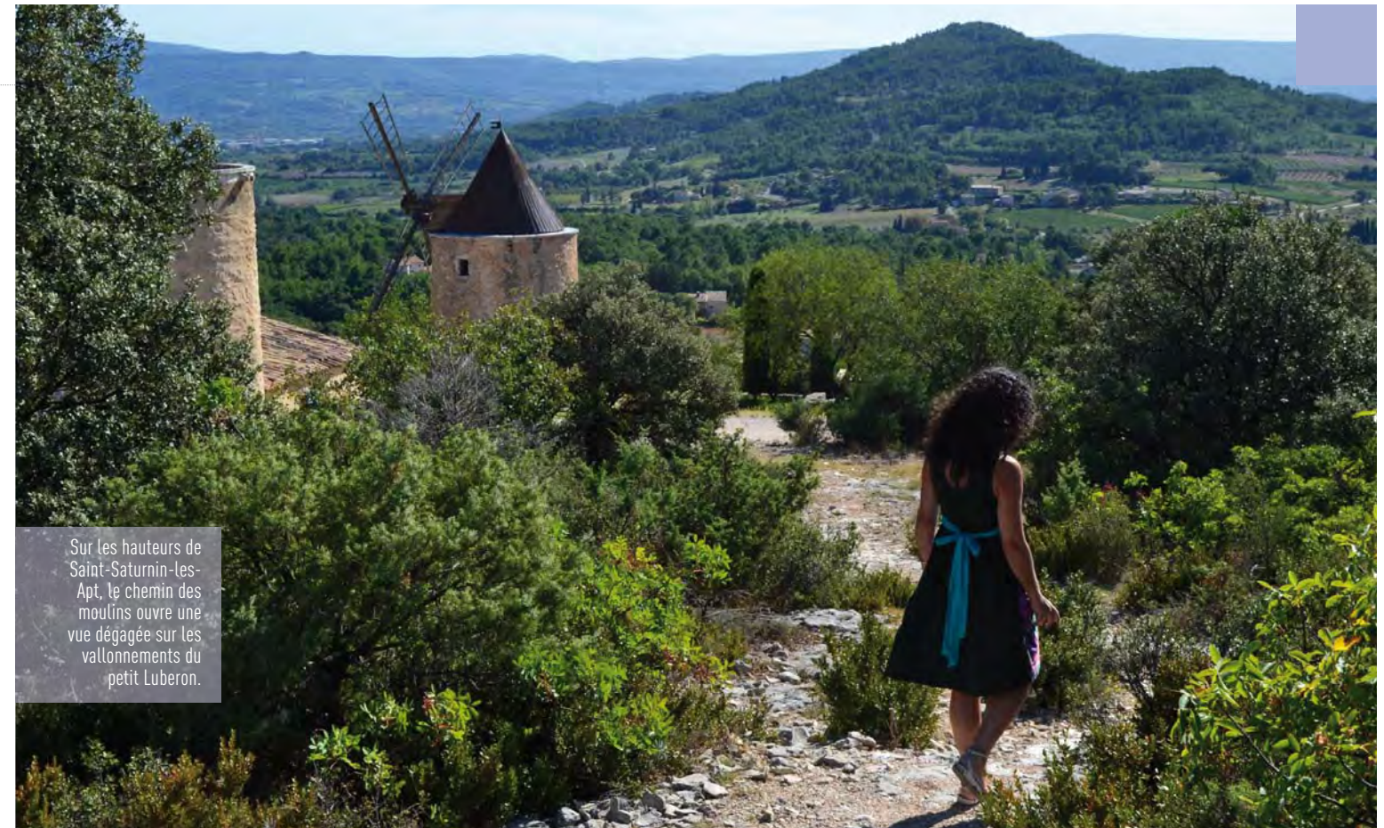
Sur les hauteurs de Saint-Saturnin-les-Apt, le chemin des moulins ouvre une vue dégagée sur les vallonnements du petit Luberon.