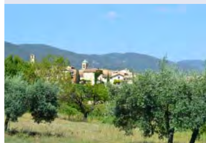
En Sud Luberon, Cadenet apparaît au loin tout empanaché d'oliviers.

Quartier Sur le parc - 84570 Malemort-du-Comtat - Tél. 04 90 69 93 02.